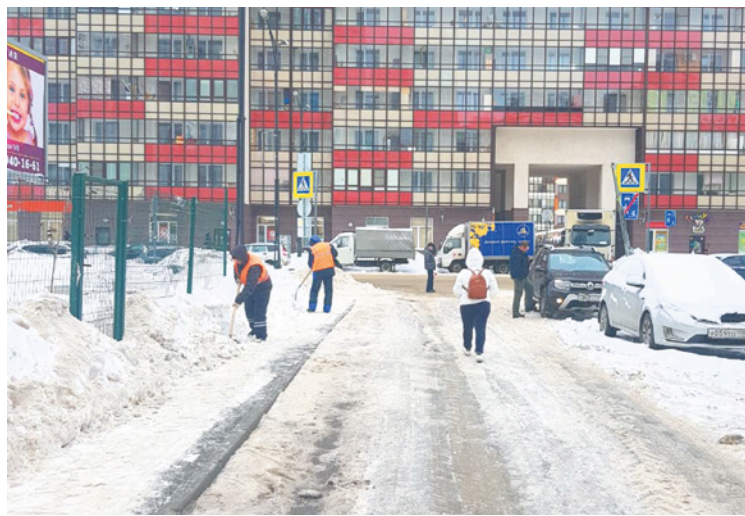
Муниципальные дороги в Кудрово чистят и посыпают круглосуточно. На фото: улица Строителей.