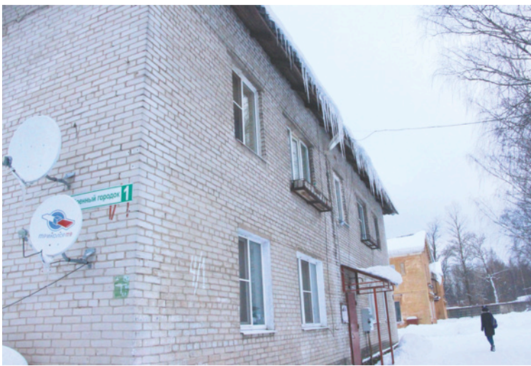
Сосульки на крыше дома на улице Военный городок, 1 в Янино-1 угрожают жизни и здоровью граждан

■ Направлять в администрацию фотоматериалы по выполненным работам один раз в два дня.