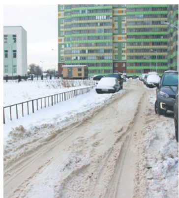
Преодоление дороги у дома № 4 по улице Австрийской является испытанием для всех, кроме УК «Невский стиль»

Уже в среду в Заневку были приглашены представители управляющих компаний, чтобы рассмотреть жалобы жителей, поступающие в администрацию Заневского поселения.