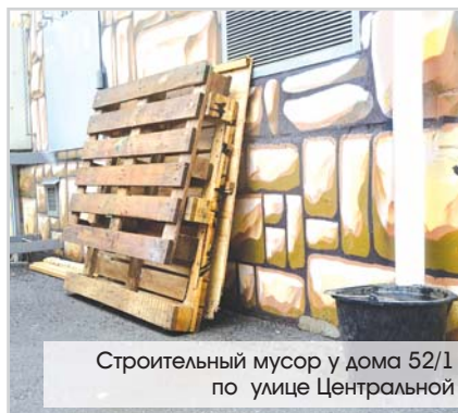
Строительный мусор у дома 52/1 по улице Центральной

На устранение замечаний управляющим компаниям дано около месяца: работы должны быть завершены до окончания официального месячника по благоустройству. Повторный обезд показет насколько добросовестно компании подошли к вопросам благоустройства на своих участках.