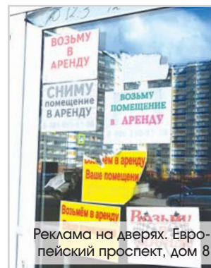
Реклама на дверях. Европейский проспект, дом 8