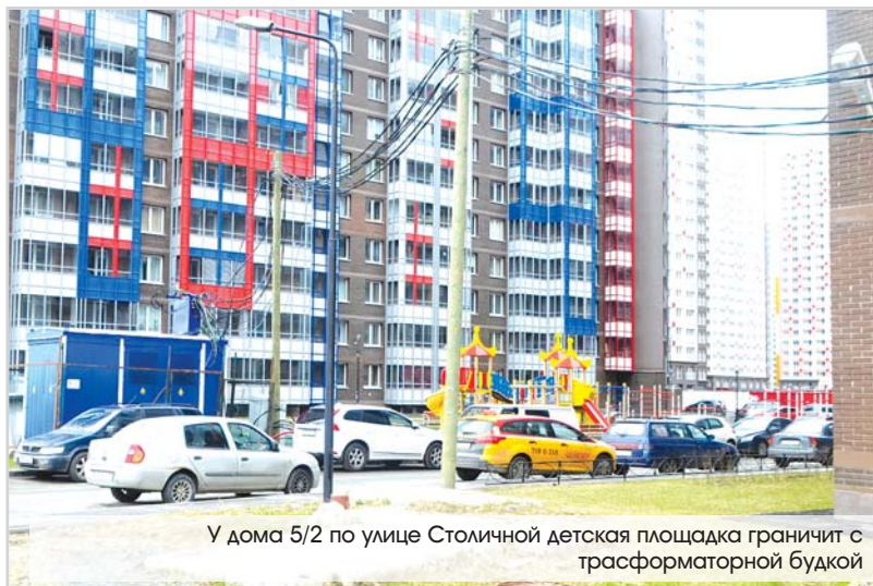
У дома 5/2 по улице Столичной детская площадка граничит с трансформаторной будкой

Приглашаем всех принять участие в весеннем месячнике по благоустройству и выйти на субботник 28 апреля 2017 года. Вместе мы сделаем наши дворы краше!