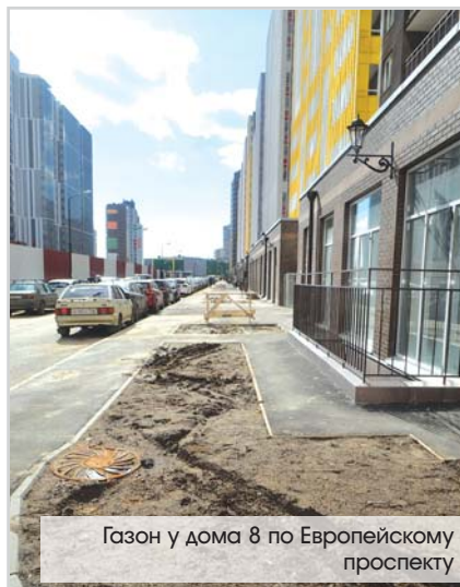
Газон у дома 8 по Европейскому проспекту