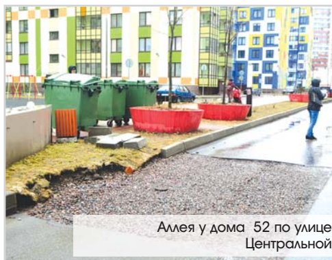
Аллея у дома 52 по улице Центральной